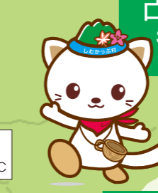
占冠村のゆるキャラ「しむかっぷ」